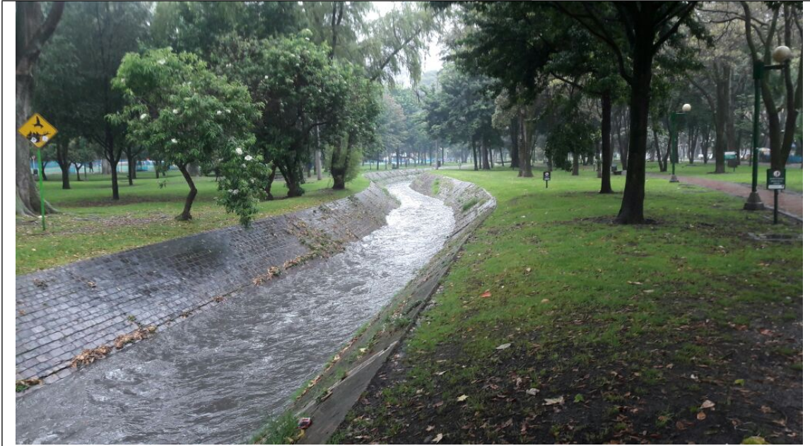
Fotografía 1. Estado del CANAL EL VIRREY aledaño al punto de intervención.