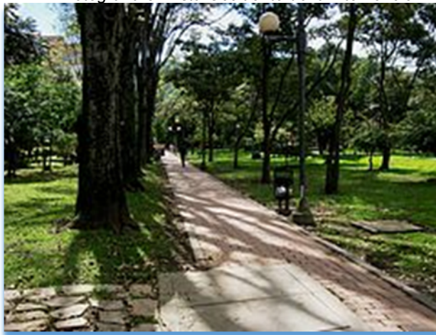
Fotografía 3. Vista Occidente de la intervención