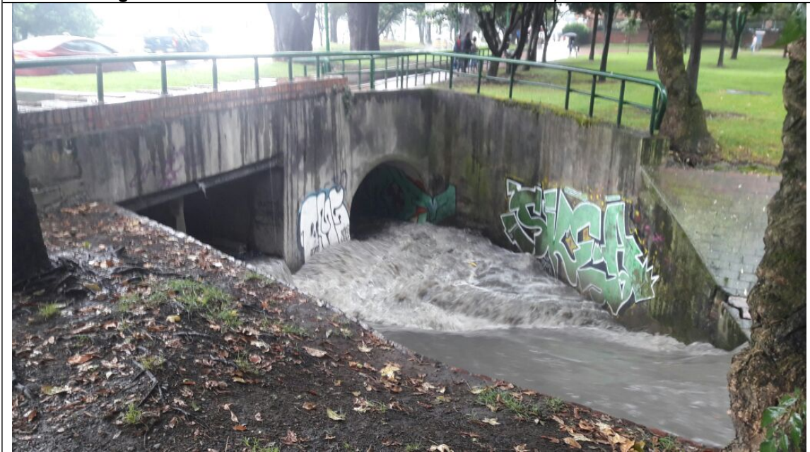
Fotografía 2. Punto de Intervención sobre estructura existente, con coordenadas Norte: 108727.941; Este: 102090.124