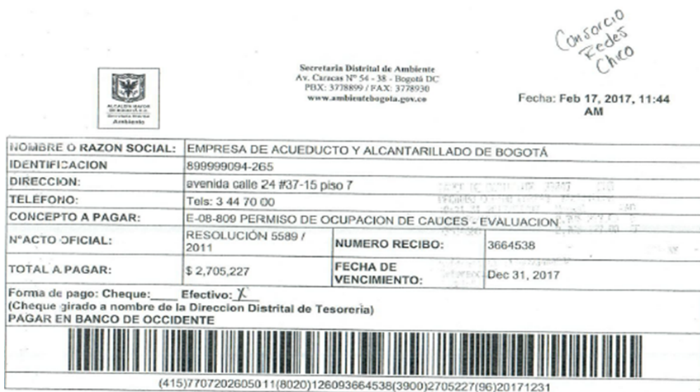
Ilustración 4. Constancia de pago para un POC, Canal el Virrey

Mediante radicado No. 2017ER75250 del 26 de abril de 2017, La EMPRESA DE ACUEDUCTO, ALCANTARILLADO Y ASEO DE BOGOTÁ – EAB relaciona copia del recibo de pago en el Banco de occidente por concepto de Evaluación del Permiso de Ocupación de Cauce del canal El Virrey, con número 3664538 del 26 de abril del 2017, por la suma de DOS MILLONES SETECIENTOS CINCO MIL DOSCIENTOS VEINTI SIETE PESOS M/CTE ($2.705.227) para el proyecto “RENOVACIÓN O REHABILITACIÓN DE LAS REDES LOCALES DE ACUEDUCTO Y ALCANTARILLADO SANITARIO Y PLUVIAL DEL BARRIO CHICÓ”